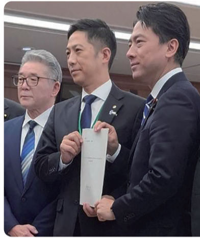
赤澤亮正経済産業大臣と