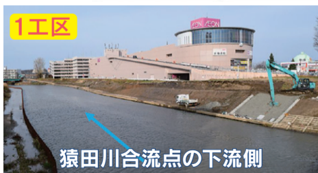
1工区 猿田川合流点の下流側