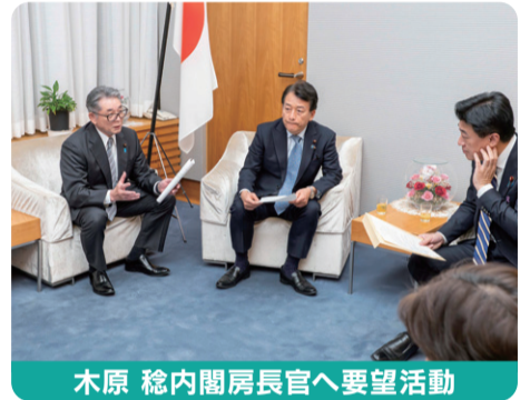
木原 稔内閣府長官へ要望活動