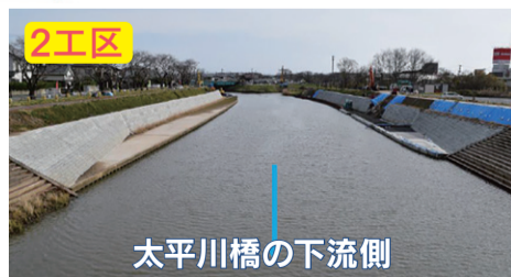
2工区 太平川橋の下流側