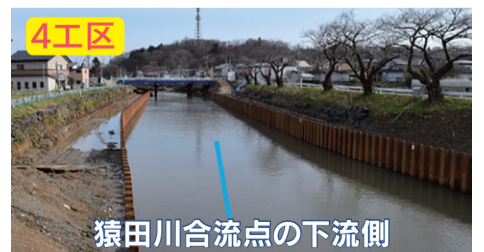
4工区 猿田川合流点の下流側