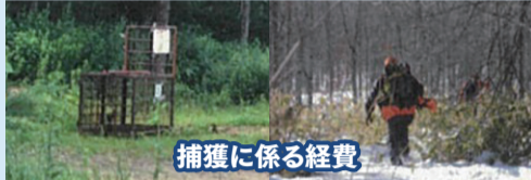
捕獲に係る経費 (箱わなの設置、捕獲者に対する支援等)