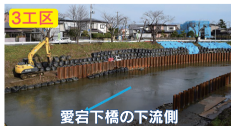
3工区 愛宕下橋の下流側