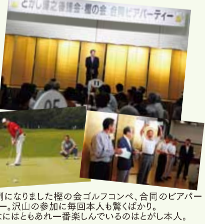
↑恒例になりました櫻の会ゴルフコンペ、合同のビアパーティー。沢山の参加に毎回本人も驚くばかり。...なにはともあれ一番楽しんでいるのはとがし本人。