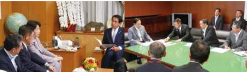
●下村博文文科大臣へ東京オリンピック事前合宿の要請 ●秋田県知事・経済団体と太田昭宏国土交通大臣へ高速道路要望