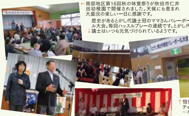
←南部地区第16回秋の味覚祭りが秋田市仁井田幼稚園で開催されました。天候にも恵まれ大盛況の楽しい一日に感謝です。歴史があるとがし代議士冠のママさんバレーボール大会。毎回ハッスルプレーの連続です。とがし代議士はいつも元気づけられているようです。