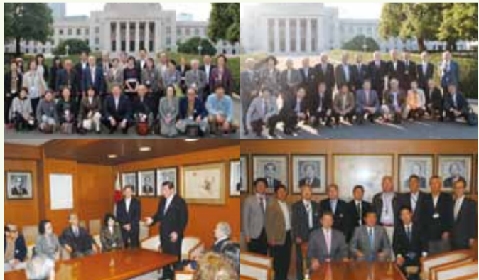
●国会議事堂、自民党本部の見学。石破幹事長から挨拶を頂く事が出来ました!! (昨年の櫻の会パーティーではご多忙の中、講師として来秋頂きました)