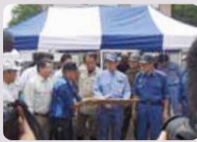
●仙北市供養佛地区土砂災害現場を視察・調査し対応を検討する(8/13)

それにより、激甚災害の早期の指定を受け、県北の農地等の災害復旧事業等の特別措置を行いました。また、供養佛地区の土砂災害については、国の直轄工事として着手しました。