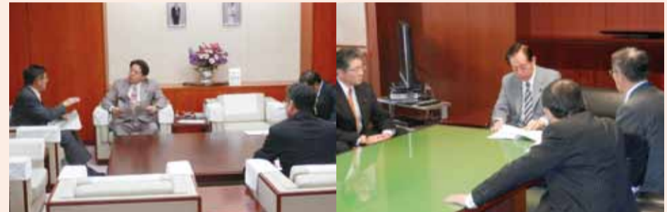
●林 芳正農林水産大臣へ予算の要望 (先の自民党AKITA未来塾に講師として来秋されました) ●太田昭宏国土交通大臣へ予算の要望