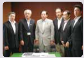
●太田昭宏国土交通大臣へ緊急の要望(8/22)