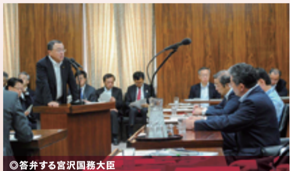
◎答弁する宮沢国務大臣

A 受益と負担の関係、効率的な送配電網の実現、事業者の予見可能性などの観点から、事業者・関係者全てにとって合理的かつ明確なルールとなるガイドラインを作成する。