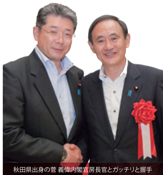
秋田県出身の菅 義偉内閣官房長官とガッチリと握手

特定失踪者問題調査会 1万キロ現地調査 秋田青森編 http://www.netlive.ne.jp/archive/SII/mobile/HAYABUSA-006.html